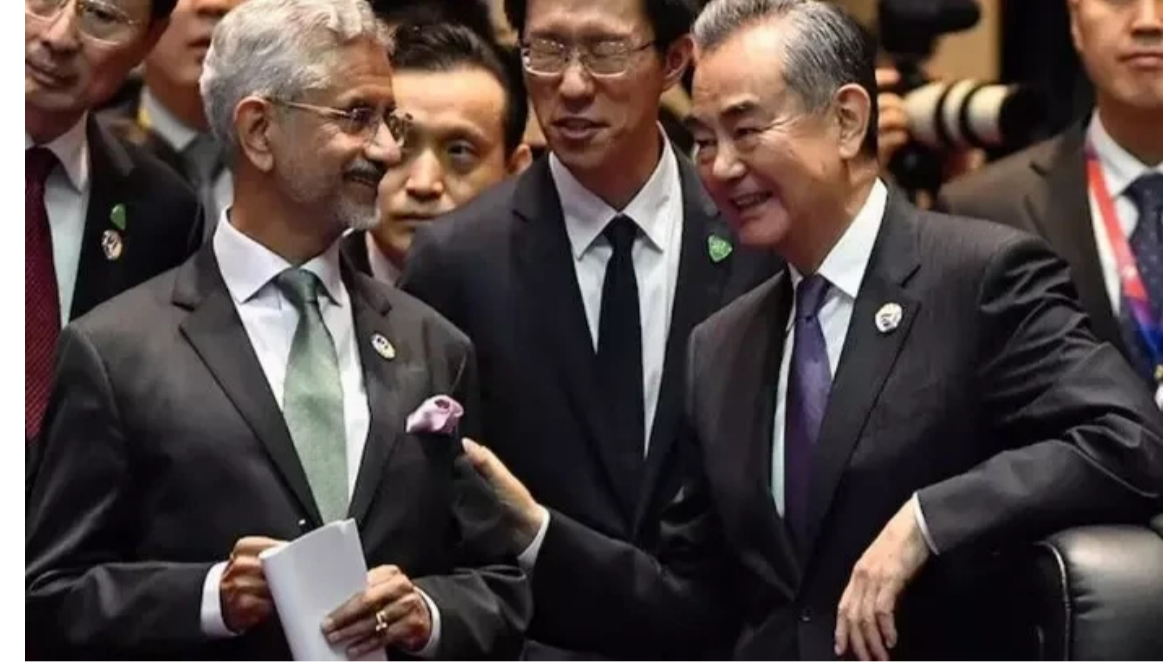
అధ్యక్షుడు జిన్ పింగ్ (త్రిశ్రీ సదస్సు సందర్భంగా కజాన్ లో భేది అయ్యారు. ఆ తర్వాతనే సరిహద్దుల్లో ఉద్రిక్తతలు ఉన్నట్లు సుంచి ఇరుదేశాల బలగాలు వెనక్కి తగ్గాయి. మరోవైపు, మరోవైపు ఈ ఏడాది షాంఘై సహకార సంస్థ సమావేశాలకు చైనా అతిథ్యం ఇస్తోంది. ఆ సదస్సులో భారత ప్రధాని నరేంద్ర మోదీ పాల్గొనడం అత్యంత కీలకంగా మారనుంది.