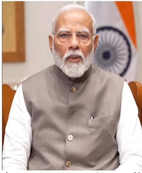
విదేశాంగ శాఖ శుక్రవారం వెల్లడించింది. మారిషస్ ప్రధానమంత్రి సవీన్ రామ్ గులాం ఆహ్వానం మేరకు మారిషస్ జాతీయ దినోత్సవంలో మోదీ ముఖ్య అతిథిగా పాల్గొంటారని తెలియజేసింది. రూ. 32 లక్షల కోట్లతో ఎన్ని సున్నాలో లెక్కించలేరు కాంగ్రెస్ ను ఎద్దేవా చేసిన ప్రధాని మోదీ సూరత్: చట్టసభల్లో సున్నా సీట్లు ఉన్న రాజకీయ పార్టీలు రూ.32 లక్షల కోట్లతో ఎన్ని సున్నాలు ఉంటాయో లెక్కించలేమని ప్రధాని నరేంద్ర మోదీ పరోక్షంగా కాంగ్రెస్ పార్టీని ఎద్దేవా చేశారు. 'ప్రధానమంత్రి ముద్రా యోజన'

సిల్వాస్సా: దేశంలో ఊబకాయ సమస్య నానాటికీ తీవ్రపాతం దాలుస్తుండడం పట్ల ప్రధాని నరేంద్ర మోదీ ఆందోళన వ్యక్తం చేశారు. 2050 నాటికి 44 కోట్ల మంది భారతీయులు ఊబకాయంగా మారతారని అధ్యయనాలు వెలుతున్నాయని గుర్తుచేశారు. ప్రతి ముగ్గురిలో ఒకరు ఊబకాయంతో అవస్థలు పడే ప్రమాదం ఉందన్నారు. ఇది నిజంగా ప్రమాదకరమైన, దిగ్రాంతి కలిగించే సంఖ్య అని చెప్పారు. ఒకటిన్నర అతిపెద్ద సబులుగా మారిందని అన్నారు. ఊబకాయ సమస్యను అధిగమించడానికి వంట నూనెల వినియోగాన్ని కనీసం 10 శాతం తగ్గించుకోవాలని మరోసారి దేశ ప్రజలకు పిలుపునిచ్చారు. వంట నూనెల వినియోగం తగ్గించుకుంటామని అందరూ ప్రతిజ్ఞ చేయాలని చెప్పారు. నిత్యం వ్యాయామం చేయాలని, శరీరంలో అవసరానికి మించి ఉన్న కొవ్వు శాతాన్ని తగ్గించుకోవాలని కోరారు. లేకపోతే భవిష్యత్తులో ఎన్నో రకాల అనారోగ్య సమస్యలు ఎదురౌతూవు పస్తుందని హెచ్చరించారు. ప్రజలకు తక్కువ ధరకే ఔషధాలు అందించడానికి దేశవ్యాప్తంగా 25 వేల జన ఔషధ కేంద్రాల ప్రారంభించబోతున్నామని తెలియజేశారు. ప్రభుత్వ అధ్యక్షులలోని మెడికల్ షాపుల్లో ఔషధాలు కొనుగోలు చేయడం పల్ల మధ్య తరగతి ప్రజలు, పేదలకు ఇష్టానికి రూ.30,000 కోట్లు ఆదా అయ్యాయని వివరించారు. ప్రధాని మోదీ శుక్రవారం కేంద్ర పారిశ్రామిక ప్రాంతమైన దాద్రా నగర్ హవేలీలో పర్యటించారు. సిల్వాస్సా పట్టణం లో జరిగిన కార్యక్రమంలో పాల్గొన్నారు. రూ.2,587 కోట్ల విలువైన వల అభివృద్ధి, మౌలిక సదుపాయాల ప్రాజెక్టులను ప్రారంభించారు. మరొకప్పుటికి శంకుస్థాపన చేశారు. అలాగే రూ.460 కోట్లతో నిర్మించిన 'సమో జ్యోత్సనా' ప్రారంభించారు.